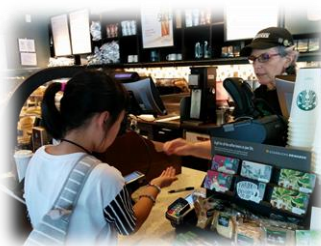
ショッピングや注文体験