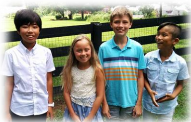
現地での様々なアクティビティ